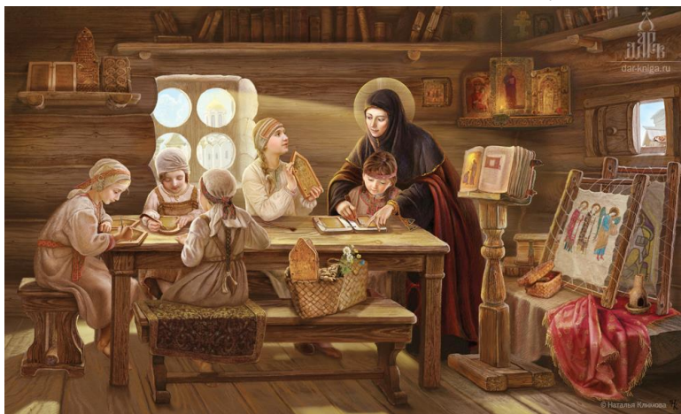
Иллюстрация «Евфросиния Полоцкая» пронизана необыкновенной теплотой, она реалистична, все персонажи: и девочки, и святая Евфросиния Полоцкая, – изображены понятно для детского восприятия.